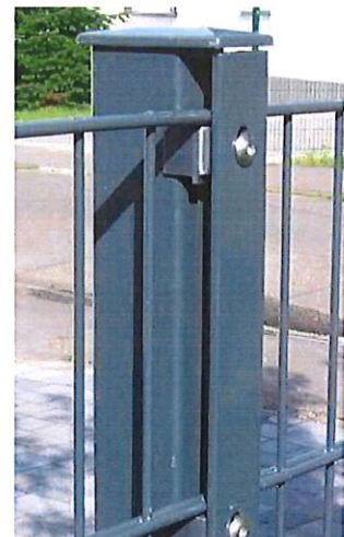
Zaunpfosten DS Premium 656, DS Profi 868 u. Schmuckzaun