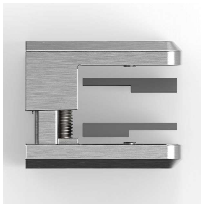
für 10 / 10,76 mm Glas for glass 10 / 10,76 mm