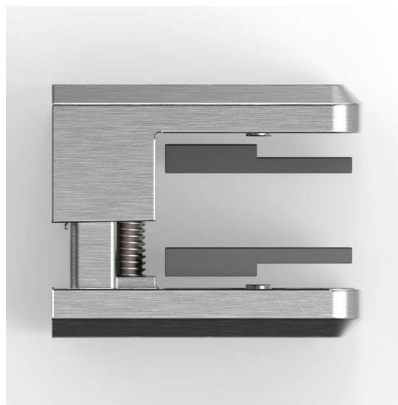
für 12 / 12,76 mm Glas for glass 12 / 12,76 mm