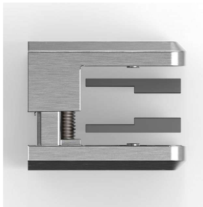
für 8 / 8,76 mm Glas for glass 8 / 8,76 mm